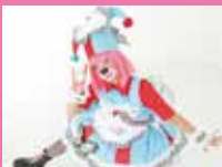
ピエロのファンキー