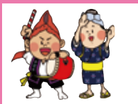
エイ坊・サーちゃん